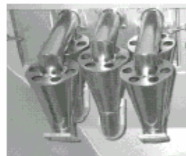
Zyklon-Anlage Cyclone installation Installation de cyclones